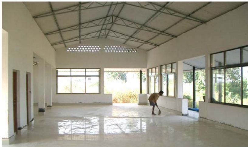
Innenraum der Halle. Links befinden sich Toiletten und Abstellräume Großzügig unterstützt wurde der Bau der Halle von der "Sir Peter Ustinov Stiftung."