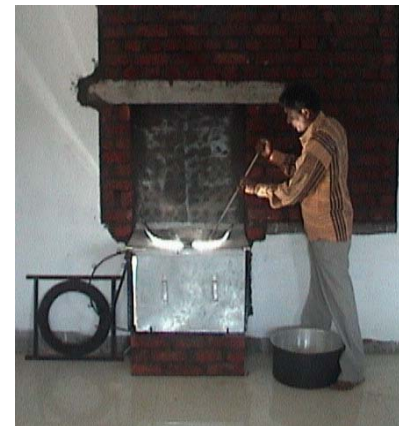
Solarkochstelle von innen ...