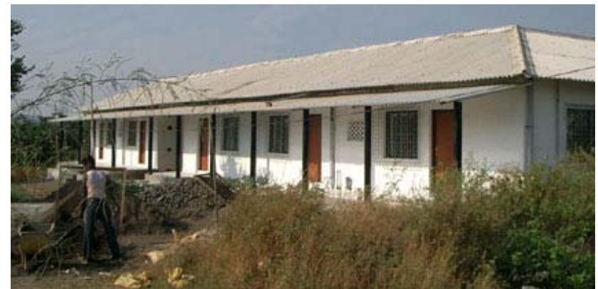
Innenhof und Außenansicht des Übergangshauses