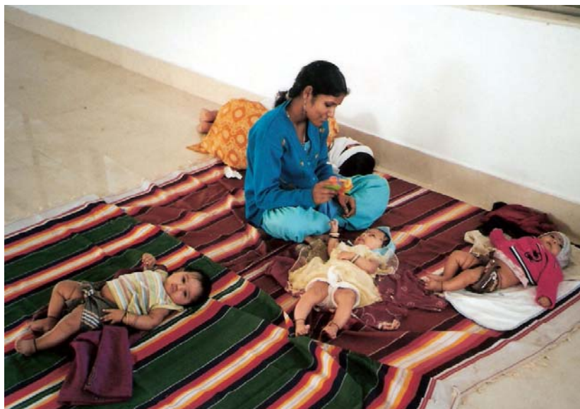
auch die drei kurz nach der Befreiung ihrer Mütter geborenen Babys waren dabei