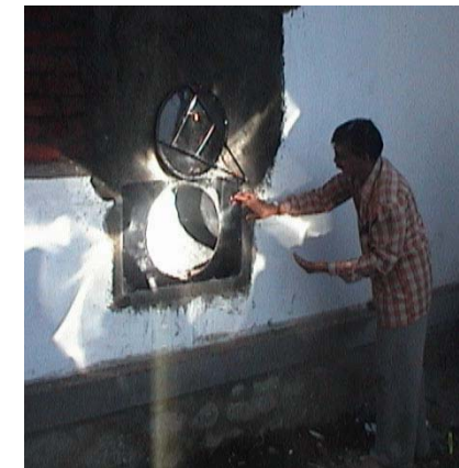
... und außen