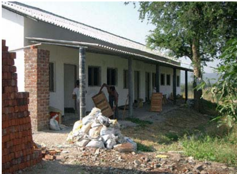
Wie allen Gebäuden auf dem Grundstück ist auch dem Personalhaus eine Veranda vorgelagert, welche die dahinter liegenden Räume vor Sonne und Regen schützt.

Im Anschluss an das Gebäude entstehen überdachte Parkmöglichkeiten sowie das Einfahrtstor mit Unterstand für unser Wachpersonal.