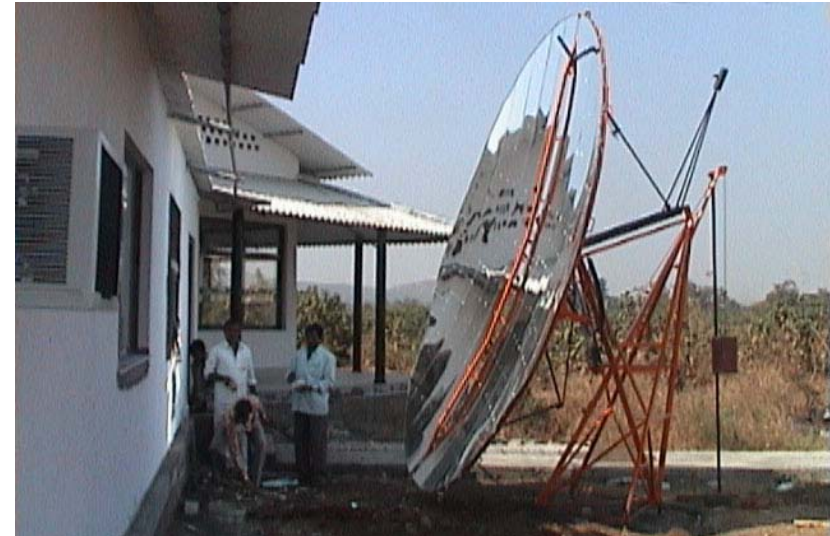
Der Reflektor vor dem Küchentrakt ist etwa 10 qm groß

Die Küche ist mit ihrer Längsseite exakt in Ost-West-Richtung ausgerichtet, da hier, neben Gas- und Holzöfen, eine große Solarkochstelle eingebaut wurde. Die Technik dafür wird in Indien entwickelt und produziert. Sie funktioniert großartig!