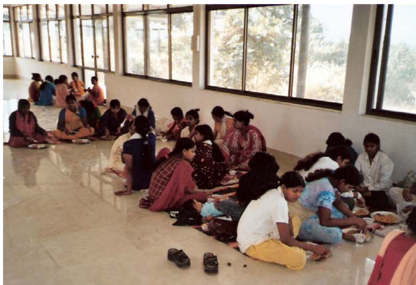
Die zukünftigen Bewohnerrinnen beim Essen in der Gemeinschaftshalle.