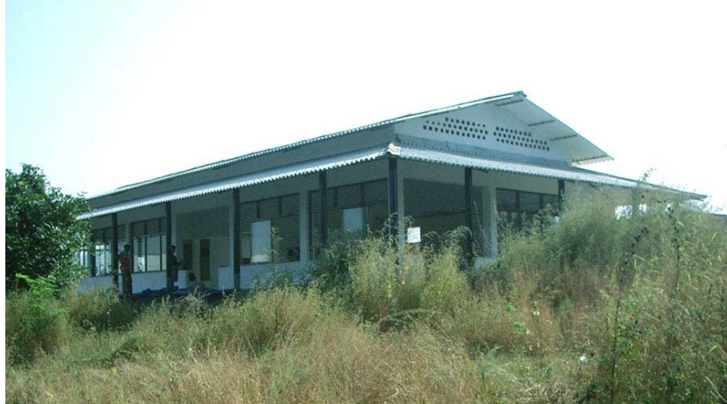
Gemeinschaftshalle mit umlaufender Veranda

Zentraler Ort innerhalb der Anlage ist die Gemeinschaftshalle mit angrenzender Küche. Mit einer Größe von etwa 300 m 2 entstand Platz für alle gemeinschaftlichen Aktivitäten. Egal ob als Speisesaal oder Spielfläche, Arbeitsraum oder Unterrichtsbereich, diese und ähnliche Nutzungen können hier je nach Bedarf nebeneinander stattfinden.