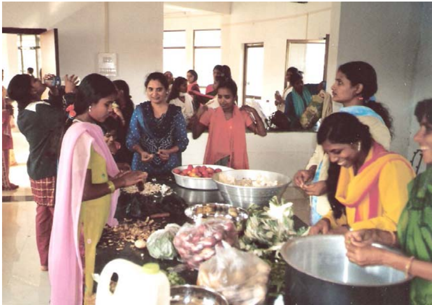
Im Dezember wurde die Küche und die anschließende Gemeinschaftshalle mit einem großen gemeinsamen Essen eingeweiht. 50 gerettete Mädchen kamen dazu extra aus Bombay.